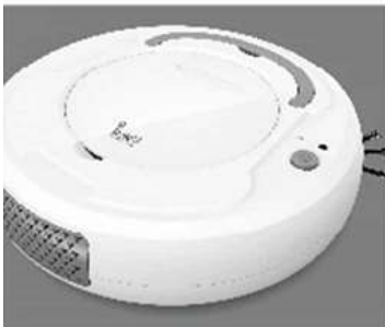
1. Tire o Limpe.Aí da Embalagem