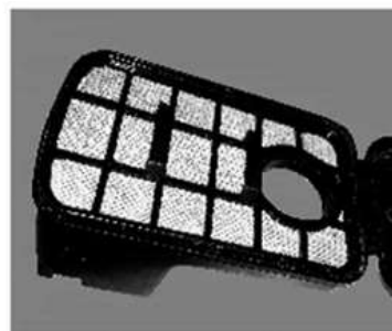
9. Mantenha limpo