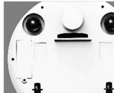
3. Só fechar a tampa