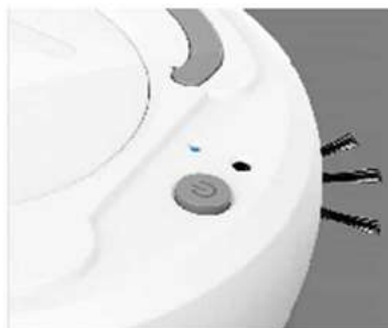
4. Apertar o botão e ligar!