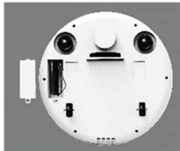
2. Coloque a bateria que acompanha o produto