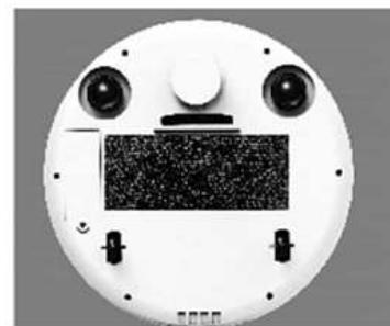
5. Modo esfregão: só colocar o pano espanador