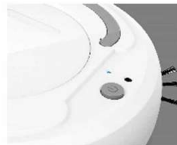
6. Azul Piscante? Hora de Recarregar